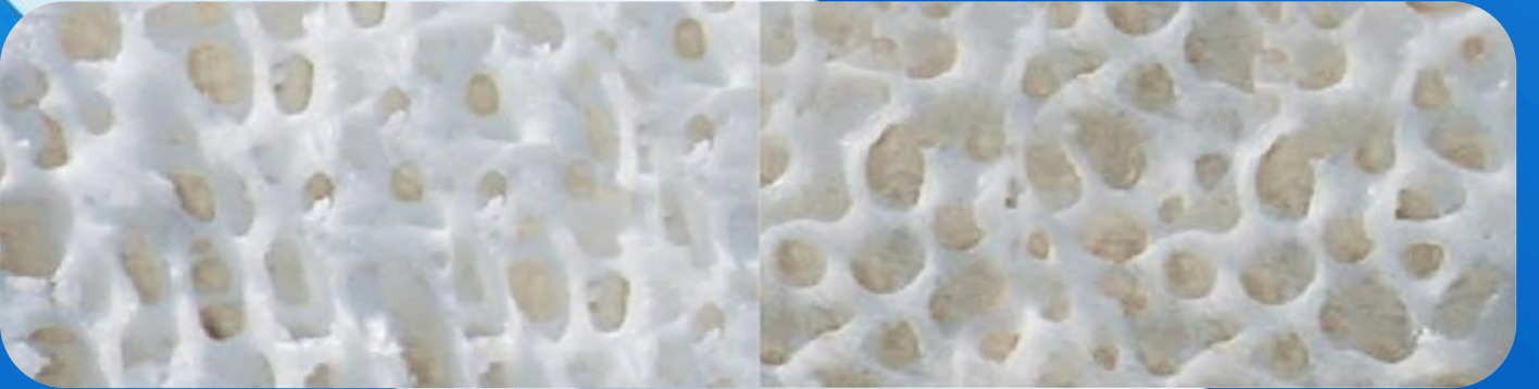
İnsan Kemiği Dokusu

Hammadde, insan gıdası tüketimine yönlendirilen ve veterinerlik sistemi ve yetkili sağlık otoritesi tarafından kontrol edilen İspanyol kökenli atlardan elde edilmektedir.